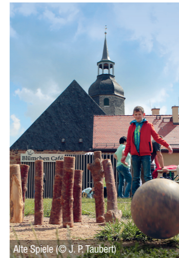
Alte Spiele