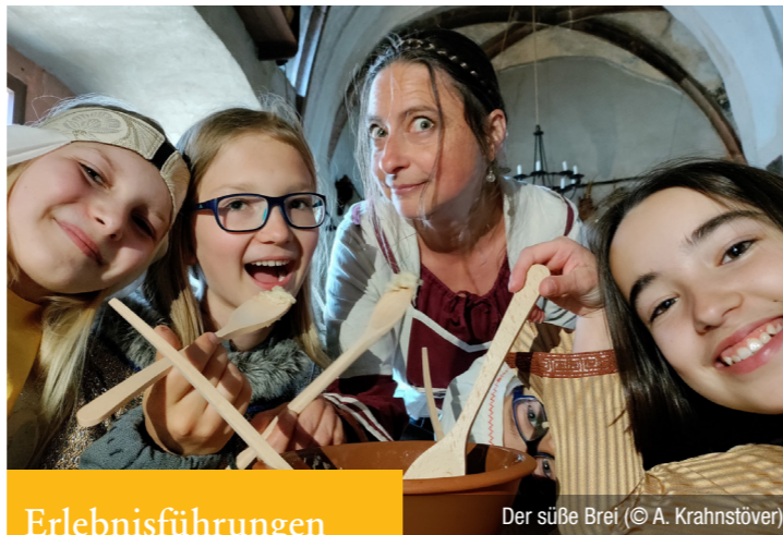
Der süße Brei (© A. Krahnstöver)