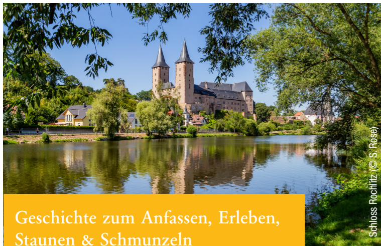
Schloss Rochlitz