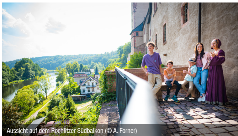
Aussicht auf dem Rochlitzer Südbalkon

So bunt und vielfältig, wie das Leben auch damals schon war, so bunt und vielfältig sind auch die Erlebnisführungen für die Kinder.