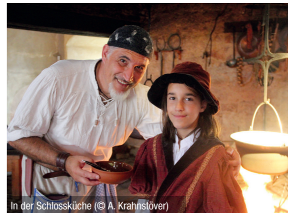
In der Schlossküche