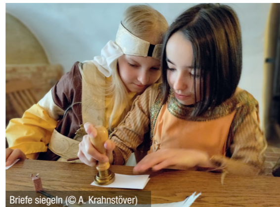
Briefe siegeln

Die Kinder haben die Möglichkeit an vier Stationen viel Wissenswertes zum Leben in dieser Zeit zu erfahren. Diese können Sie aus den nachfolgenden sechs Angeboten auswählen: