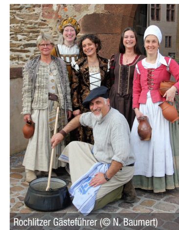
Rochlitzer Gästeführer