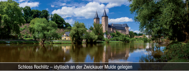
Schloss Rochlitz – idyllisch an der Zwickauer Mulde gelegen