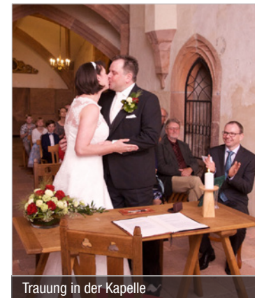
Trauung in der Kapelle