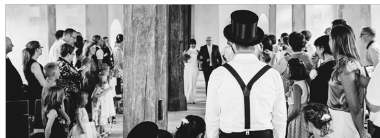
Eheschließung im Tafelsaal