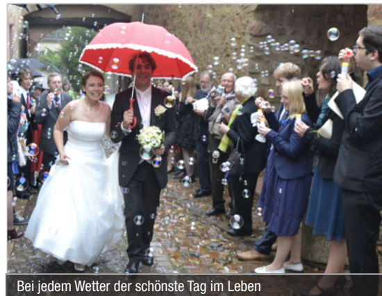
Bei jedem Wetter der schönste Tag im Leben