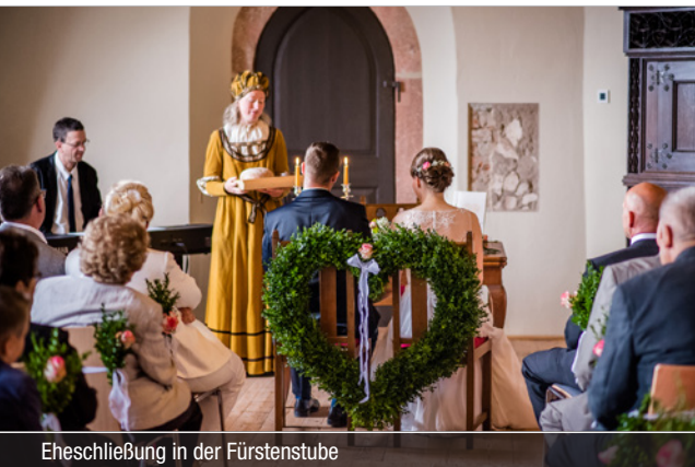
Eheschließung in der Fürstenstube

Sprechen Sie uns an – Wir beraten Sie gern!