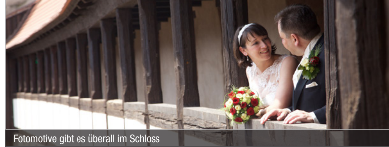
Fotomotive gibt es überall im Schloss